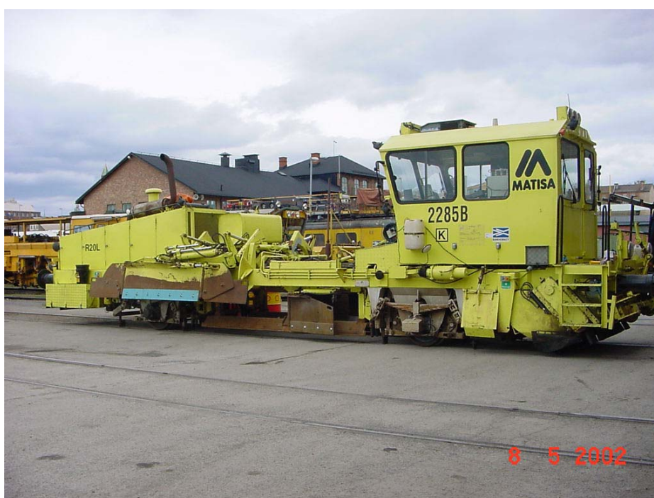
Figur 2:1 Bild av hur ett av Banverket Produktions fordon kan se ut.

Banverket Produktion är Nordens ledande järnvägsentreprenör och sysslar med att underhålla och bygga ny järnväg. Banverket produktion skiljdes från Banverket 1998, 10 år efter att tågtrafiken avreglerats och SJ delats upp och skiljts från Banverket. Sedan 2002 konkurrerar man på en öppen marknad. Banverket produktion har ca 3000 anställda och äger 450 specialfordon som på olika sätt är anpassade för att klara av det mesta när det gäller järnvägsunderhåll och bygge av ny järnväg. Banverket Produktion har sex distriktskontor belägna i Stockholm, Luleå, Gävle, Nässjö, Göteborg och Malmö. 1