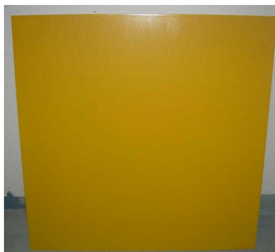
Figur 5:6 Yta behandlad med klotterskydd 9606.

Detta skydd appliceras med roller, spruta eller pensel. Jag använde roller vid min applicering. Efter blandning av komponenter bör skyddet appliceras inom två timmar. Full motståndskraft mot klotter finns efter 48 timmar. Även detta skydd är mycket lättapplicerat, dock något svårt att få en jämn yta med roller då lätt luftbubblor bildas. Att spruta på skyddet skulle nog vara att rekommendera på stora ytor. Skyddet bildar en något blek matt yta.